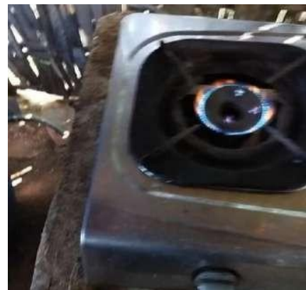
Gambar 7. Kompor gas dengan hasil gas fermentasi kotoran sapi