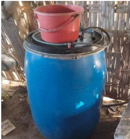
Gambar 6. Drum atau tangki proses fermentasi