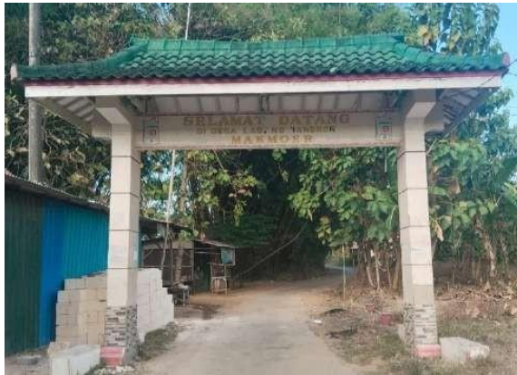
Gambar 1. Gapura Dusun Tangkor, Desa Labang, Sreseh Sampang