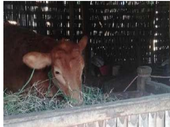
Gambar 2. Sapi Ternak Warga, jenis local khas madura

Tujuan dari pengabdian ini adalah memberikan pengetahuan kepada masyarakat bahwa pembuatan biogas dari kotoran sapi ini untuk mengetahui campuran dan pengolahan untuk menghasilkan biogas, mengetahui lama nyala api yang dihasilkan dari produksi biogas dan mengetahui hasil produksi biogas dari limbah kotoran sapi. Sedangkan manfaat dari pengabdian ini memberikan bagi Masyarakat menambah pengalaman dan pengetahuan yang lebih luas tentang pemanfaatan limbah kotoran sapi sebagai penghasil energi, mengurangi pencemaran pada lingkungan yang disebabkan melimpahnya limbah kotoran sapi.