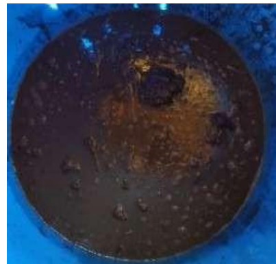
Gambar 5. Campuran kotoran sapi dan air