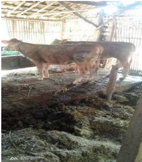
Gambar 4. Kotoran sapi lokal madura